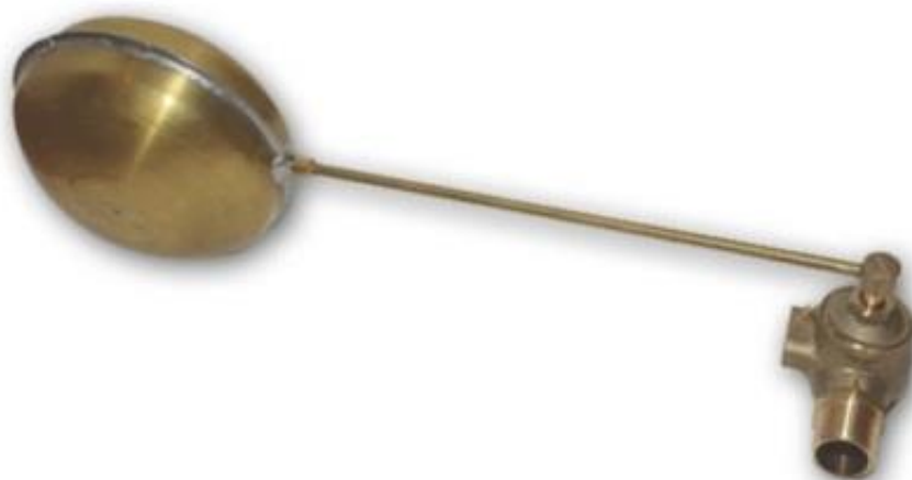
Bóia vazão total. Balão plástico ou metálico de ½ à 2'.