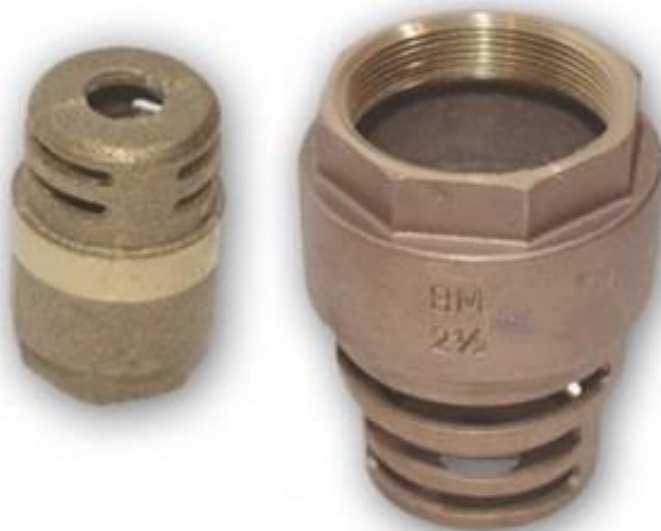
Válvula de Retenção de fundo de poço 3/4 até 4' - ROSC BSP. Pressão de 200 PSI vedação em borracha de neoprene.