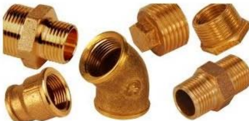
Conexões em latão.